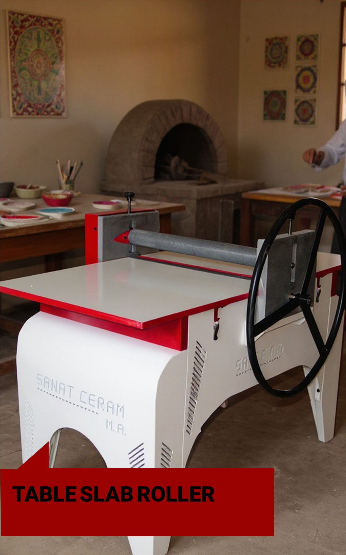
TABLE SLAB ROLLER